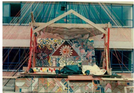
Páginas anteriores: Primer Esquisse del Bestiario, 1984