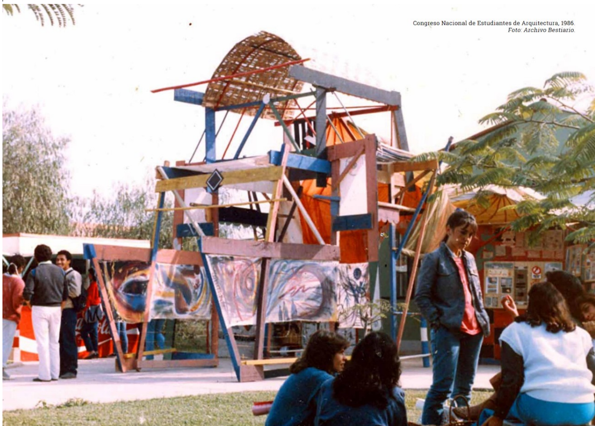
Congreso Nacional de Estudiantes de Arquitectura, 1986.