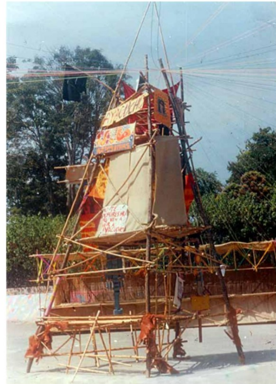
SICLA, 1986.