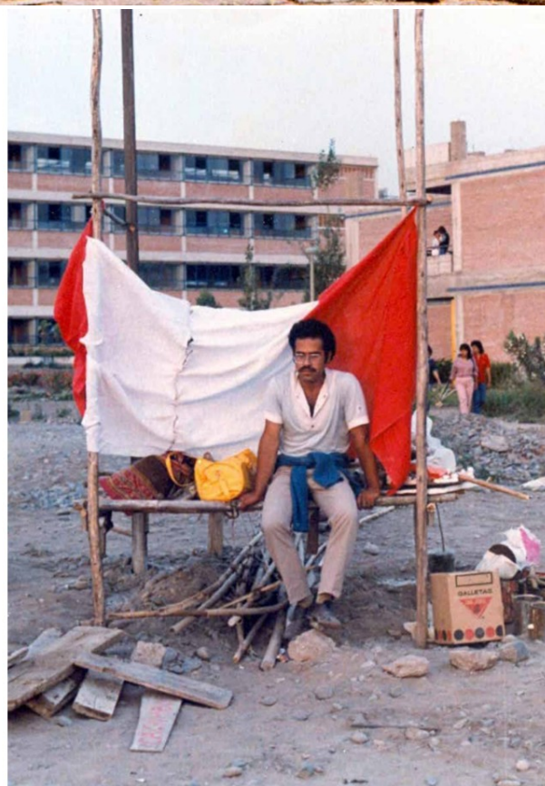
Des-Hechos en Arquitectura, 1984.

"Lo que queremos es introducir en el contexto de la URP la realidad que existe fuera de su reja perimetral. ..."